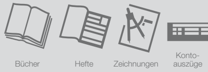
Bücher Hefte Zeichnungen Kontoauszüge